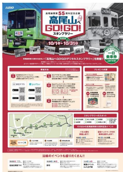
《スタンプラリーポスターイメージ》