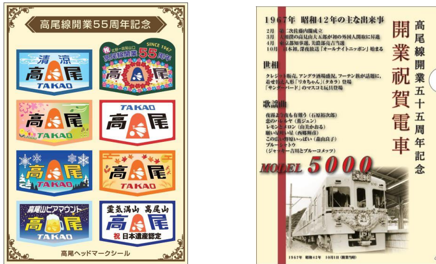
《高尾ヘッドマークシールとクリアファイル》

参加にはスマートフォンから「京王アプリ」と「SpotTour」の順にダウンロードが必要です。そのうえで京王高尾線(京王片倉駅・山田駅・めじろ台駅・狭間駅・高尾駅・高尾山口駅)と、高尾登山電鉄高尾山駅の計7駅の改札外に設置された二次元コードをよみとり、7つのスタンプを全て集めると、先着でA5サイズの「高尾ヘッドマークシール付き特製クリアファイル」がもらえます。さらにクリアファイルと同時にもらえるWチャンス賞の応募用紙で応募すると、抽選で1名様に記念ヘッドマーク(新品未使用)が、5名様に高尾599ミュージアムグッズが当たります。