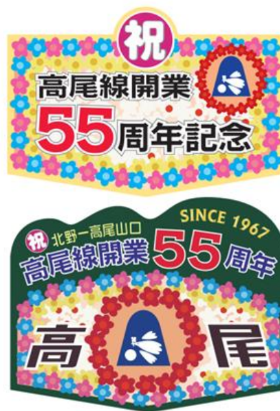
《記念ヘッドマークイメージ》