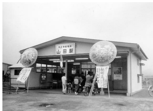
《パネル展写真イメージ》