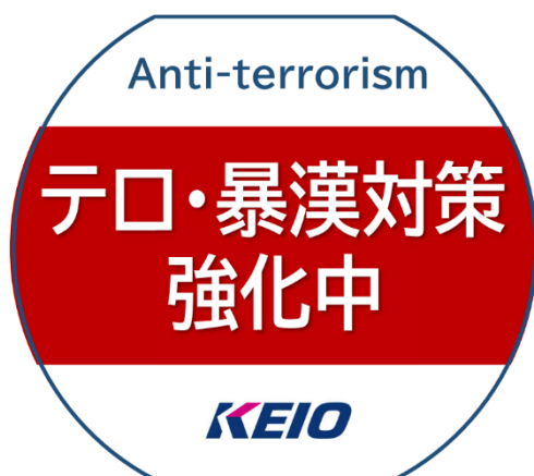
《テロ防止PRワッペン（イメージ）》