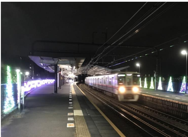
《駅のイルミネーション装飾（昨年の様子）》

※環境面に配慮してLED電球を使用するほか、電力供給事情を鑑み昨年より規模を縮小するほか逼迫状況によっては消灯します。