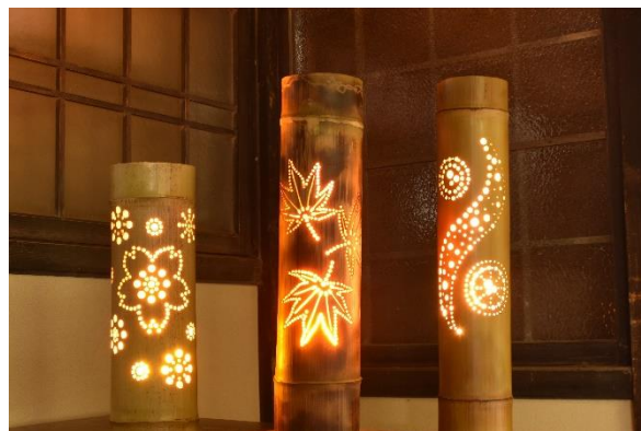
《オリジナル竹細工イメージ》