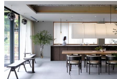
奈良 高畑町 MIROKU