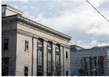
北海道 函館 HakoBA