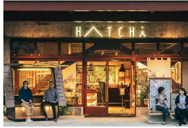
石川 金沢 HATCHi