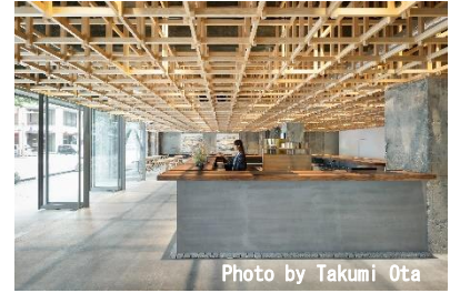
石川 金沢 KUMU