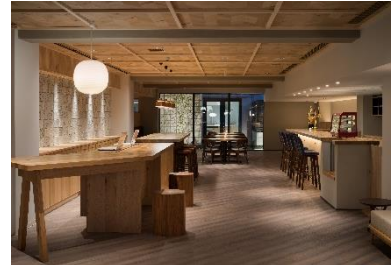
京都 丸太町 RAKURO