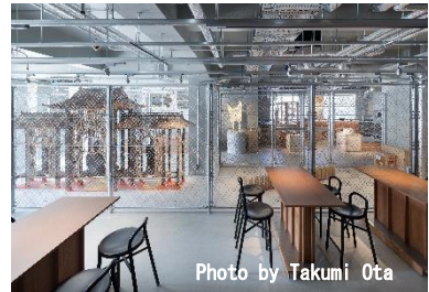
東京 浅草 KAICA