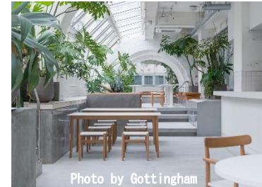
広島 八丁堀 KIRO