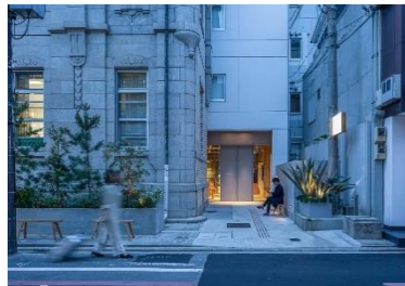
京都 三条 TSUGU