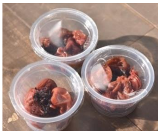
《京王百草園手作りの梅干し》