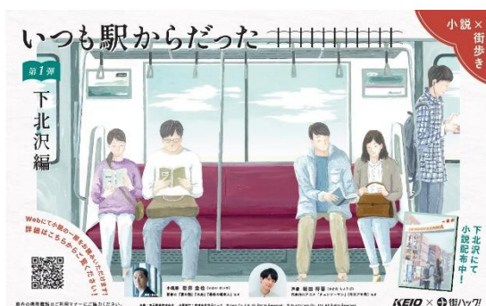
《メインビジュアルイメージ》