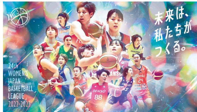
<Wリーグメインビジュアル>

世界トップクラスの選手が所属する女子バスケットボールのトップリーグ。第24回大会では、全14チームによる2回戦総当たり制を実施。レギュラーシーズン上位8チームがプレーオフに進出し、ステップラダー方式にて女王を決める。昨シーズン（第23回大会）のプレーオフファイナルでは、過去最多となる7,151人の観客を動員。