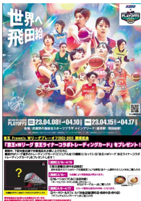
《ポスターイメージ》