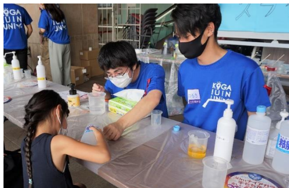
《Science Create Project の活動》

工学院大学の学生プロジェクト「Science Create Project」は、小学生を中心とした子ども向けの理科実験に関する教材開発に取り組み、学内外のイベントで実験を通して科学の面白さを伝える活動を行っています。2018年からみつばちプロジェクトとともに、ハチミツを使ったものづくりに挑戦。科学的な知見を活かした企画・提案、ラベルデザインの制作、広報活動などに協力しています。