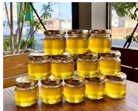
《みつばちプロジェクトが採蜜したハチミツ》