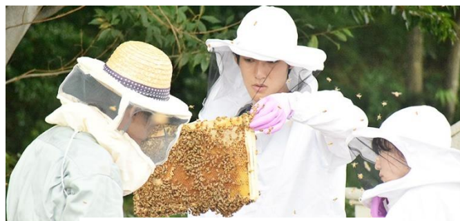
《みつばちプロジェクトの活動》