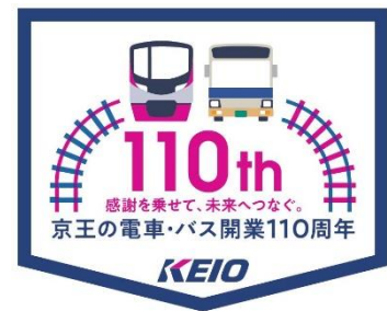
《記念ヘッドマーク（イメージ）》