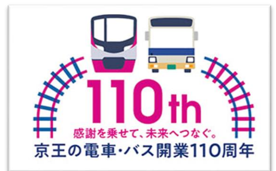
《京王線開業110周年 記念乗車券（イメージ）》