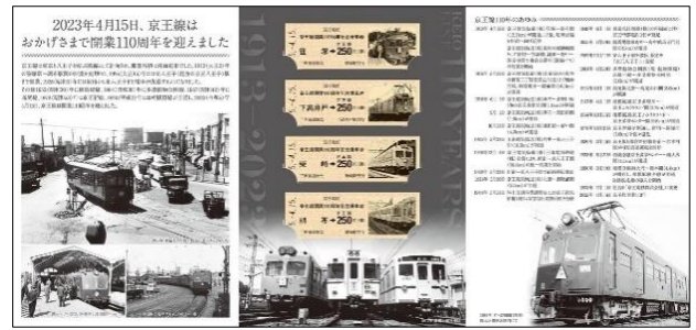
《D型硬券と台紙裏（イメージ）》