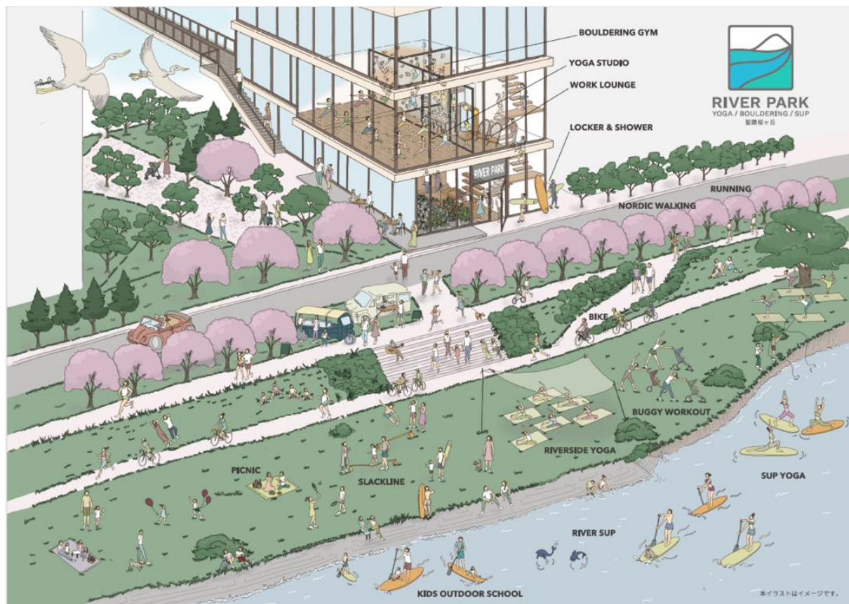
《施設運営イメージ》