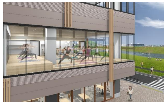
《施設イメージパース》