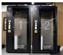
▲ STATION BOOTH