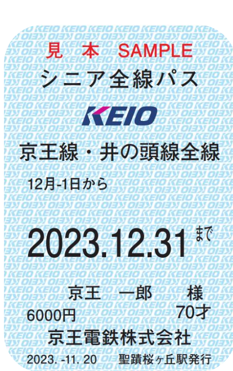
《シニア全線パス（イメージ）》