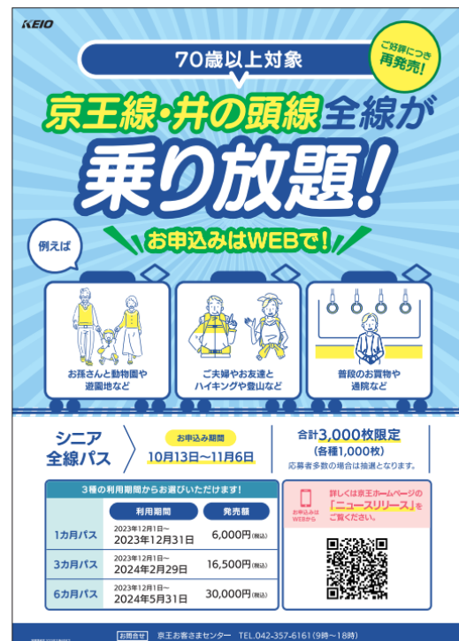
《ポスター（イメージ）》