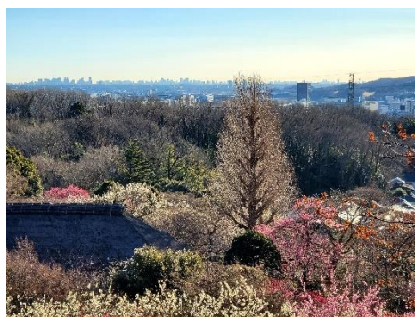
《見晴台からの景色》