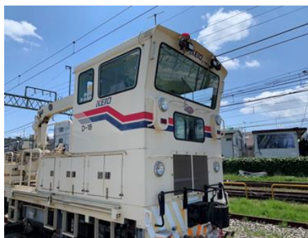
軌道モーターカー