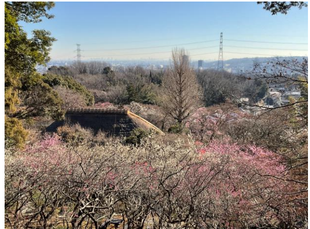
《園からの眺望（昨年の様子）》