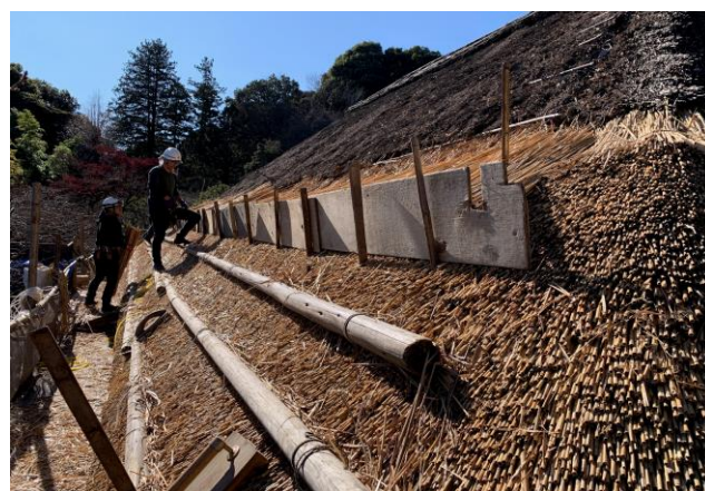
《茅葺屋根葺き替えの様子》