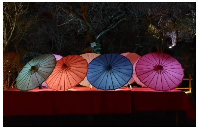
《番傘ライトアップ》