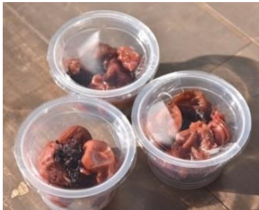
《京王百草園手作りの梅干し》