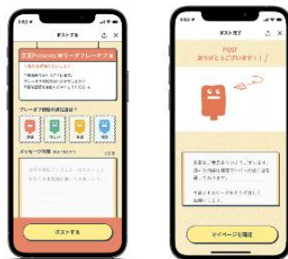
《投稿画面のイメージ》

※投稿内容に応じて、運営側よりご返信やお便り、追加のご質問をさせていただく場合がございます。