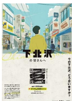
《ポスターイメージ》

※VOCは「Voice Of Customer」の略で、アンケートやコールセンターへの問い合わせなど直接企業に届いた意見をはじめとした「お客様の声」を意味します。