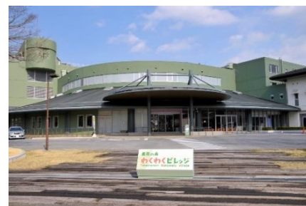
《高尾の森わくわくビレッジ 外観》