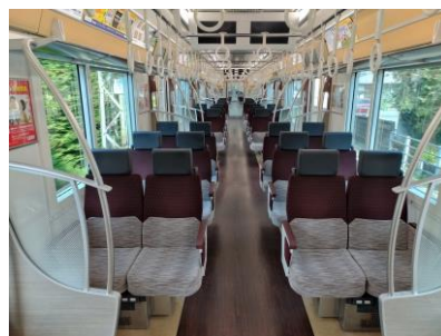
《京王ライナーの車両内》