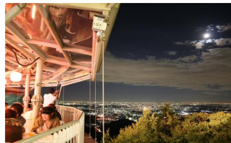
《高尾山ビアマウントからの眺望》