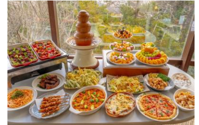
《高尾山ピアマウントの料理》