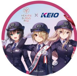
《ヘッドマーク(イメージ)》