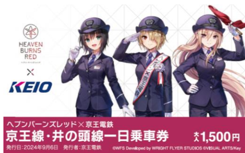
《京王線・井の頭線一日乗車券》