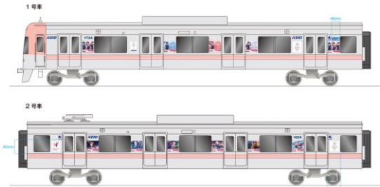
《ラッピング車両(イメージ)》