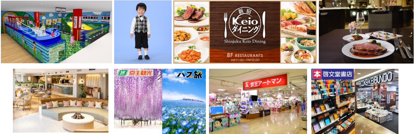
《京王グループ優待（イメージ）》

※「京王NEOBANK」では、親権者の方の「京王NEOBANKアプリ」から、0～14歳のお子さまの口座の開設をすることができます。