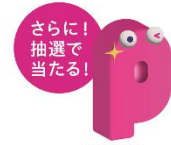
さらに! 抽選で 当たる! 対象年齢 6才〜 キャラクターぬいぐるみ 20名様