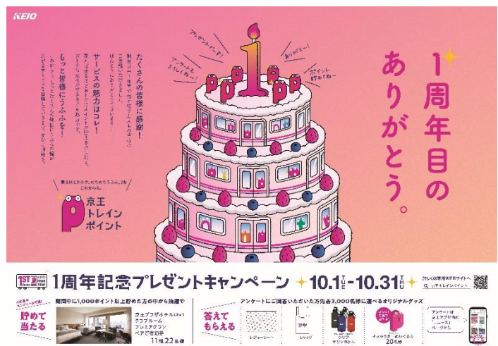
《ポスターイメージ》