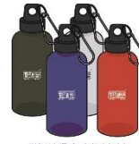
※色はお選びいただけません クリア マリンボトル