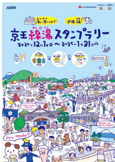
≪ポスター（イメージ）≫