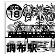
《駅設置ハンコ(イメージ)》

スタンプ設置駅に配するハンコは、各銭湯のハンコのデザインに合わせ、東京都公衆浴場業生活衛生同業組合公認の銭湯ハンコ作家「十四三(としぞう)氏」が作成しました。