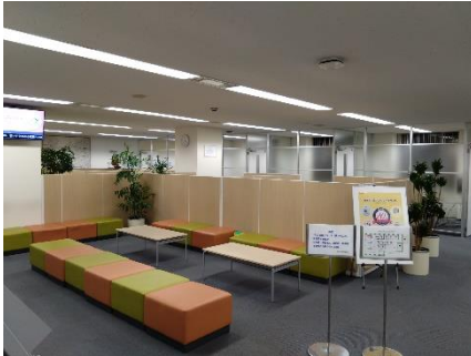
《展示場所イメージ》

なお、京王電鉄の本社ビル1階打ち合わせコーナーを12月25日（水）13時から17時の間に限り、一般開放します。