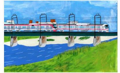
《展示作品イメージ》