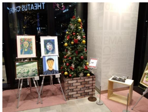
《2023年「巡回展」開催の様子》