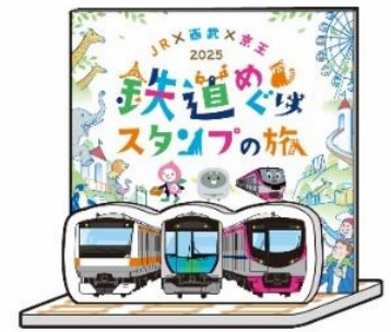
《オリジナルアクリルスタンドイメージ》 ※背景は紙製です。

※コンプリート賞の「オリジナルアクリルスタンド」は数に限りがあり、お一人様おひとつのお渡しでございます。 無くなり次第配布終了となります。