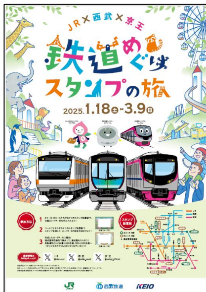
《ポスターイメージ》