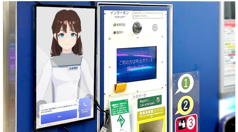
《AIアバター駅係員「こころ」設置イメージ》