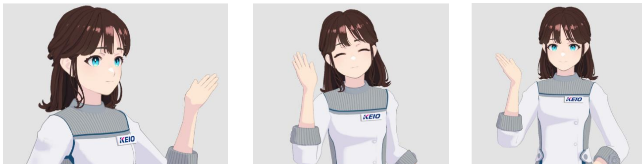
《AI アバター駅係員「こころ」イメージ》

AI というと「心」を持たない冷たいイメージがありますが、アバターとして人が操作することも想定しており、新人駅係員としてお客さまと「心」を通わせる役割であることを意味しています。お客さまに安心感を与える存在になってほしいという思いから命名しました。地域と密接に関わる存在として、駅の玄関口である改札にすることで、将来に向けて地域の人々の「心」に寄り添う存在でありたいという願いを込めています。