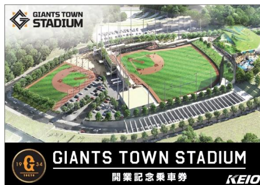
《特製台紙 表紙デザイン》