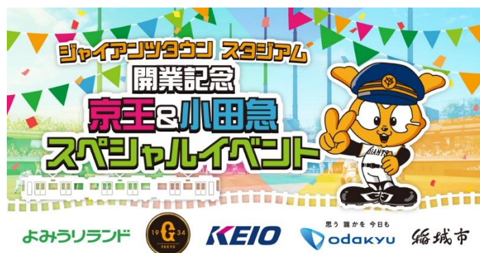
《イベントキービジュアル》

本企画を通し、5者それぞれが連携を強化することで、京王電鉄・小田急電鉄沿線ならびに稲城市の活性化および、よみうりランド・ジャイアンツタウンスタジアムへの旅客誘致を図ってまいります。