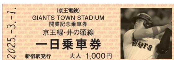
《D型硬券乗車券デザイン》