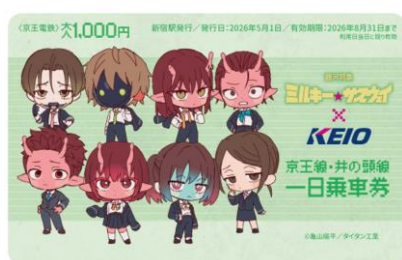
《京王線・井の頭線一日乗車券》