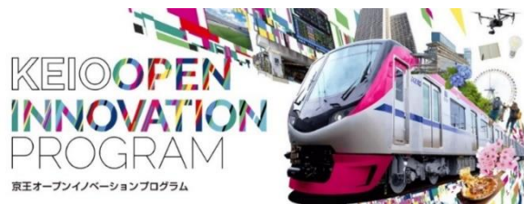
《京王オープンイノベーションプログラムメインビジュアル》

https://www.keio.co.jp/news/update/news_release/news_release2025/pdf/nr20260202_keiorailfund.pdf