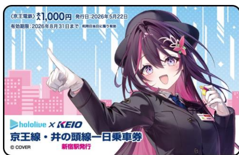
《京王線・井の頭線一日乗車券》