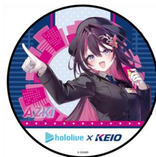
《ヘッドマークイメージ》