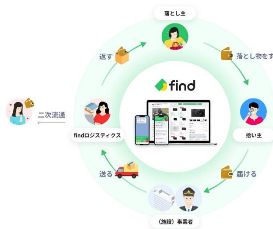
《ビジョンイメージ》

find 社は「落とし物が必ず見つかる世界へ」というビジョンのもと、「新たな感謝を生み出す、世界的な落とし物プラットフォームを創る」をミッションに掲げています。将来的には、全世界の落とし物にまつわる課題を循環型のサービスによって解決していくことを構想しています。