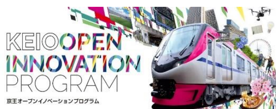
《京王オープンイノベーションプログラムメインビジュアル》