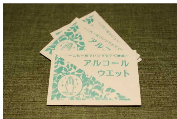
《客室アメニティ (アルコール除菌ウェットティッシュ)》