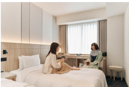
《客室(スタンダードツイン)》