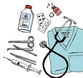
医療従事者など感染リスクのある方