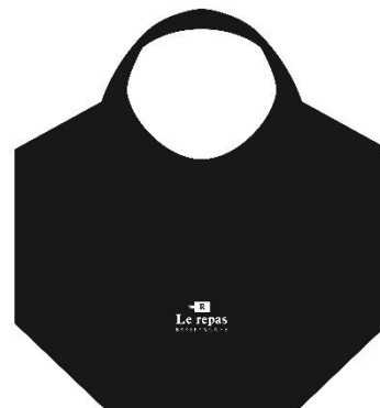
《オリジナルエコバッグ（イメージ）》