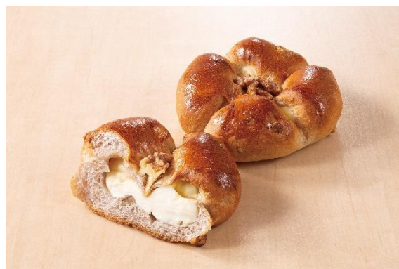
《復刻パンの一例（カマンベル・ノア）》