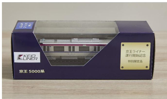
《京王 5000 系Nゲージダイキャストスケールモデル》 （特別限定品）