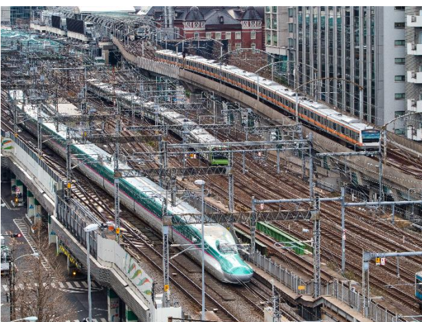
《トレインビュールームからの展望》