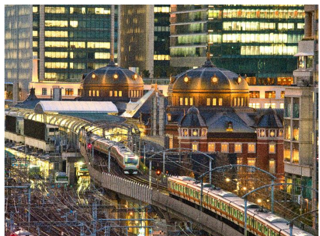
《トレインビュールームからの展望》