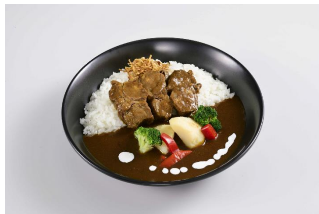
《やわらか牛タンビーフカレー》