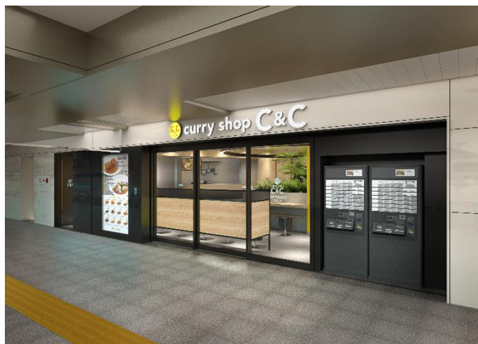
《カレーショップC&C新線新宿店 外観イメージ》

新型コロナウイルス対策を万全に行い、お客様が安心してお食事を楽しめるよう努めてまいります。ぜひお立ち寄りください。