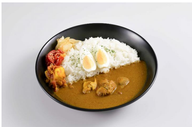
《スパイシーチキンカレー》