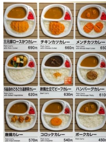
《テイクアウトメニュー(一覧)》