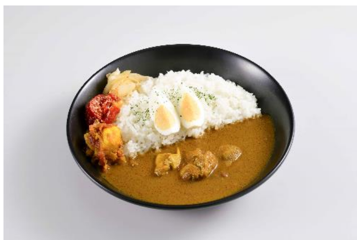
《スパイシーチキンカレー》