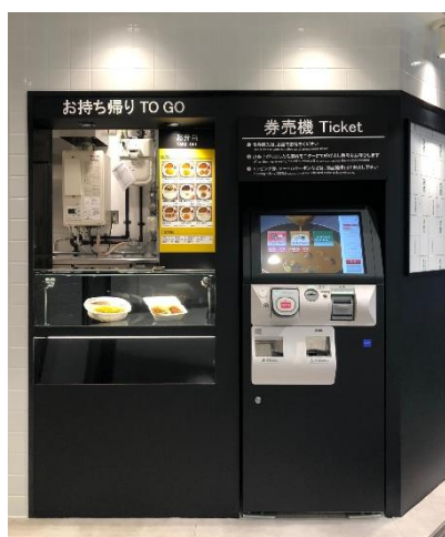
《テイクアウト販売専用カウンター》