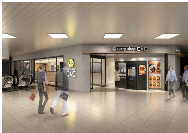
《店舗の外観(イメージ)》

レストラン京王では、新型コロナウイルス感染症予防対策を万全に行い、お客様が安心してお食事を楽しめるよう努めてまいります。ぜひお立ち寄りください。