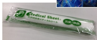
新型コロナウイルス感染防止対策