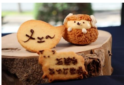
<メェーメェーシュー>