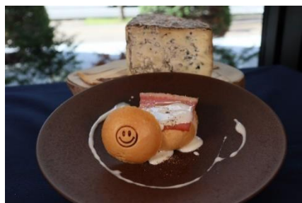
<石狩ブルーカルボナーラ>