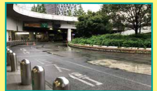
新宿駅西口地下バスのりば