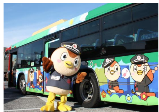
《西東京バス公式キャラクター・にしちゅん》