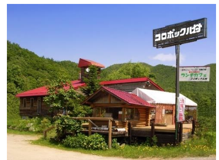
<赤井川コロポックル村>