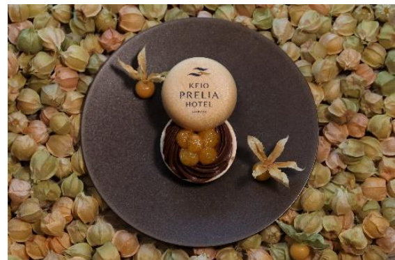
<ほおずきを使ったプレリア風最中>