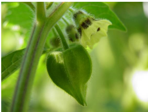
<フルーツほおずき>

当ホテル朝食では、“美味しい”に加えて、お客様が朝食を楽しみながら、北海道食材の新たな一面を知り、生産者の課題解決や応援にも繋げていく取り組みを引き続き行っていきます。