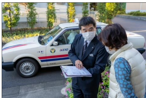
▲定期訪問による見守り イメージ