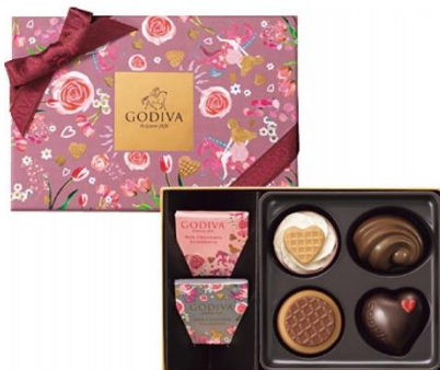
ゴディバ メリーゴーランド ワッフル アソートメント (6粒)