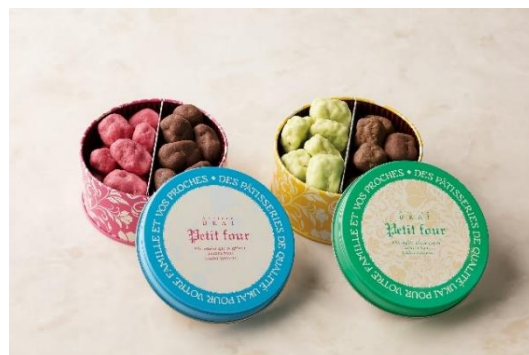
ショコラ アソルティ缶 (イチゴ&カカオ/マスカット&紅茶) (アトリエうかい)