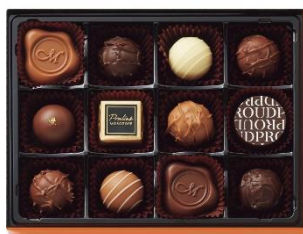
モロゾフ プラウド トリュフアソートメント