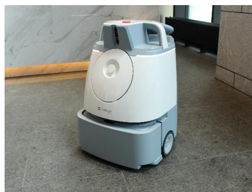
《AI 清掃ロボットの活用》