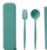
カトラリーセット