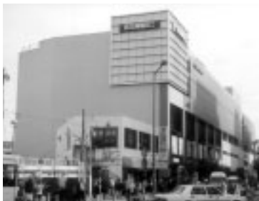
京王高幡ショッピングセンター

A館／京王ストア、京王アートマン ほか B館／京王百貨店、専門店、レストラン街 C館／スポーツクラブ、レストラン街 ほか 駐車場／1,100台収容