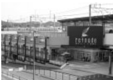
京王リトナード若葉台