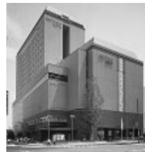
京王プラザホテル八王子

また、宿泊特化型ホテルとして京王プレッソインをチェーン展開しており、1号店の東銀座に続き、2号店の神田、3号店の池袋、4号店の五反田、5号店の新宿、6号店の茅場町がオープンしております。また2005（平17）年秋には大手町にオープンする予定です。