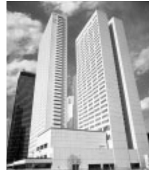
京王プラザホテル（新宿）