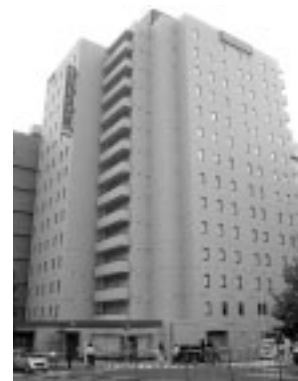
京王プレッソイン茅場町