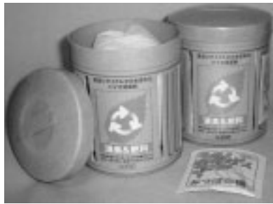
バイオ消臭剤「消臭&肥料」

「リサイクルパッケージシステム」とは、グループ各社で実績のある食品リサイクル法への対応や食品リサイクル処理についてトータルコーディネートした循環型リサイクルシステムを、グループ以外の企業に対して提案、構築するものです。