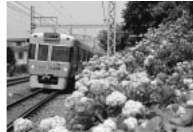
線路わきの環境保全としての緑化