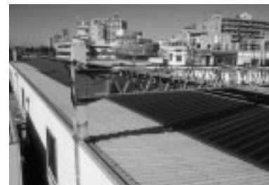
太陽光発電システム

2001（平13）年2月から、明大前駅、若葉台駅、高幡不動産車両基地の3施設で、太陽光発電システムを導入し、照明や自動券売機などの業務用電力の一部として活用しています。