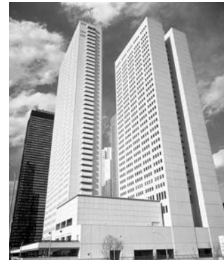
京王プラザホテル（新宿）

駅前のファッションナブルな商業施設として、「フレンテ」の開発を進めており、2007（平19）年7月には「フレンテ南大沢」がオープンしました。