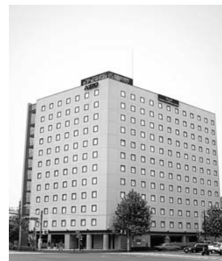
京王プレッソイン大手町