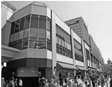
京王高幡ショッピングセンター

A館／京王ストア、京王アートマン ほか B館／京王百貨店、専門店、レストラン街 C館／スポーツクラブ、レストラン街 ほか 駐車場／1,100台収容