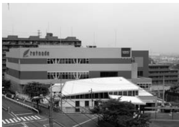
京王リトナード稲城