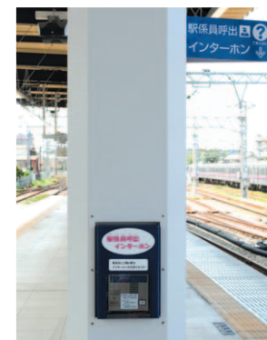
ホームインターホン

ホーム上で緊急事態が発生した場合やご案内が必要な場合などに、駅係員と通話できるインターホンを27駅に設置しています。