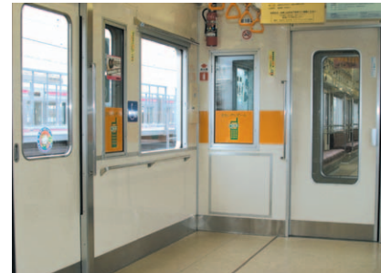
車内車いすスペース

車いすをご利用のお客様のために、車いすスペースを京王線9000系車両、8000系車両と井の頭線1000系車両の全編成に設置しています。また、京王線7000系車両についても、車体改修にあわせて設置しています。