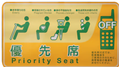
優先席案内ステッカー