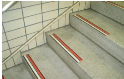
歩行路標識シール

階段の段差を視覚的に認識しやすいよう、階段踏面の端部にシールを貼付することなどにより、明度差をつけています。