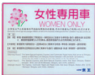
女性専用車ステッカー

なお、女性専用車には女性のお客様のほか、小学生以下のお客様、お身体の不自由なお客様とその介助者の方もご乗車いただけます。