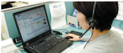
京王お客さまセンター

当施設は、お客様への総合窓口として、鉄道に関するご案内や沿線のイベント情報などに関するご質問にお答えするほか、お客様から寄せられるご意見・ご要望に、きめ細やかに対応しています。