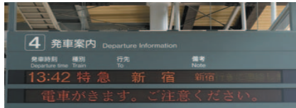
列車接近電光表示板

列車が駅に接近していることを電光表示と音声でお知らせするための列車接近電光表示板と、列車接近放送装置を設置しています。